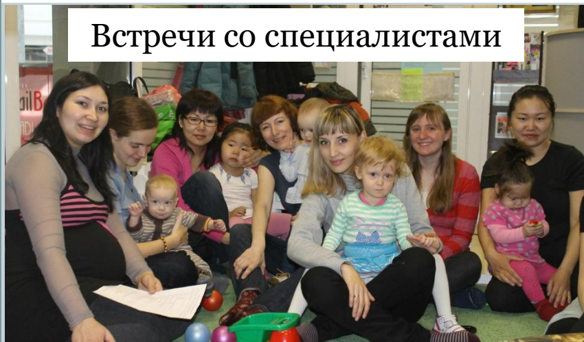
Встречи со специалистами