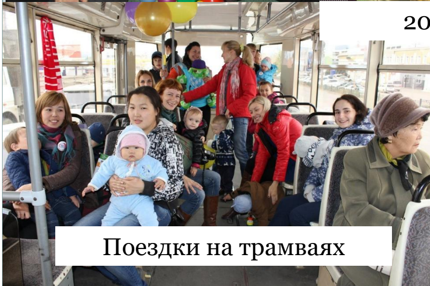
Поездки на трамваях